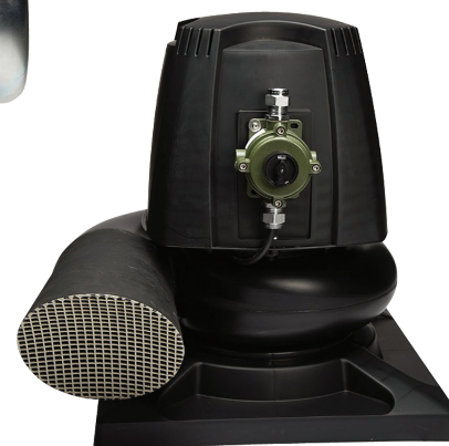
Wersja dachowa SEAT

Specjalne wykonania wentylatorów VISP i VASP do użytku w strefach zagrożenia wybuchem, kategoria urządzeń 3G zgodnie z dyrektywą ATEX 2014/34/UE. Oznaczenie ATEX II 3G c IIB T4.